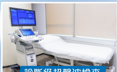
診斷級超聲波檢查