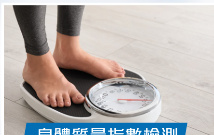
身體質量指數檢測