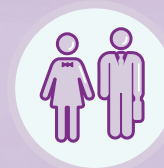
50-64歲 人士 1.4倍 ^