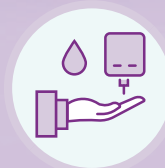
糖尿病 患者 2.5-3.1倍