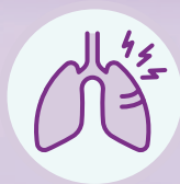
慢性肺炎 疾病患者 6.2-9.8倍