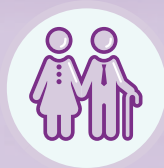
65歲或 以上人士 4.8倍 ^